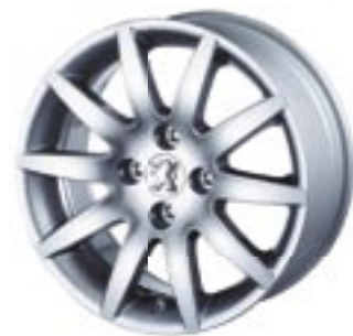
Lita platišča Izalco 16"

Kot lastnik vozila peugeot 308 CC, naj bo kupe ali kabriolet, ste lastnik dveh vozil v enem. Poudarite dvojno lastnost vozila z izborom litih platišč, da bodo poudarila estetiko in dinamični videz vašega vozila.