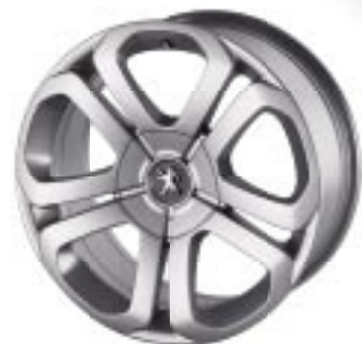
Lita platišča Lincancabur 18"

Lita platišča med dodatno opremo zasedajo pomembno mesto. Z njimi lahko poudarite stilsko obliko vozila in mu date osebni pečat.