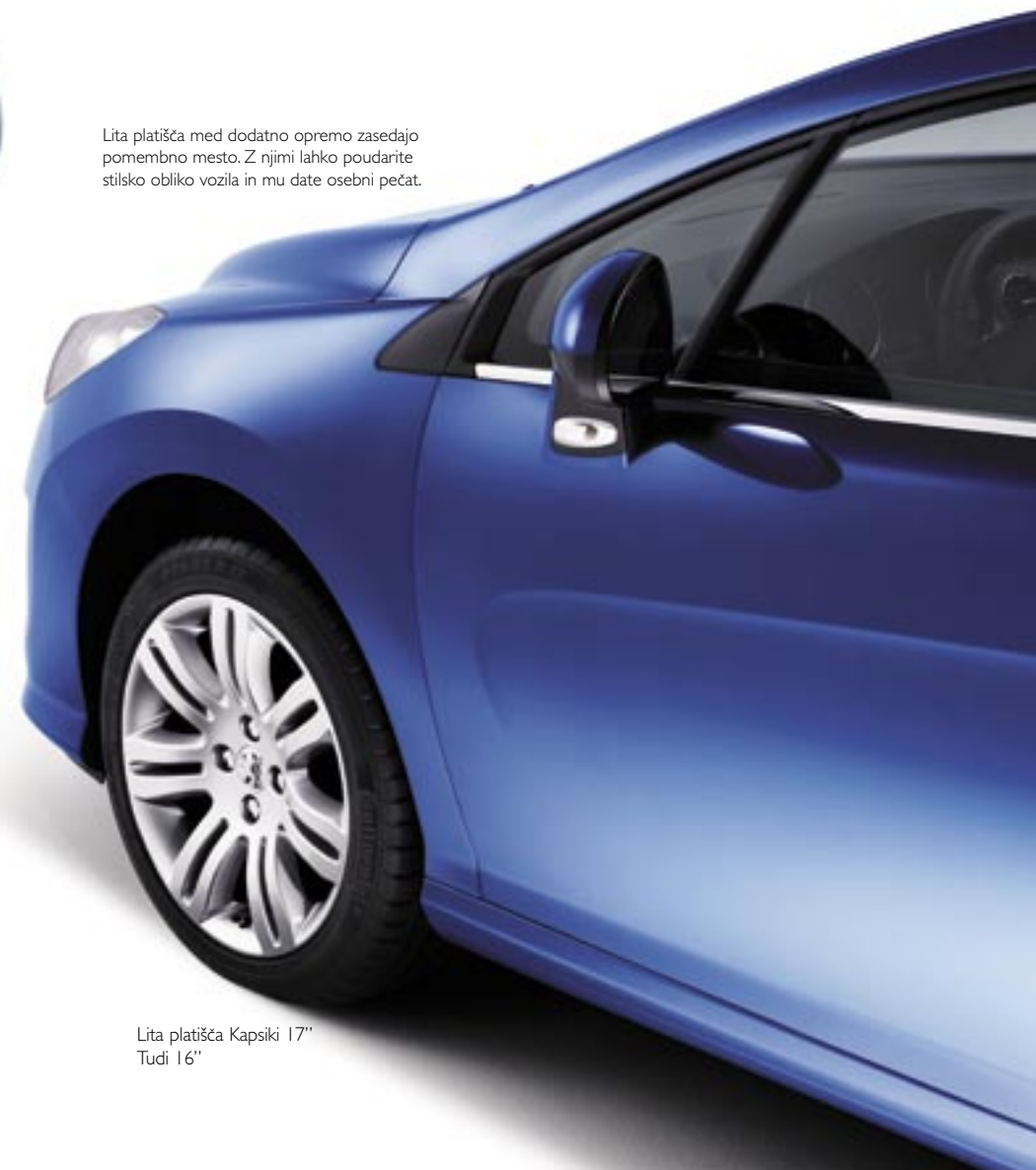
Lita platišča Kapsiki 17" Tudi 16"

Lita platišča med dodatno opremo zasedajo pomembno mesto. Z njimi lahko poudarite stilsko obliko vozila in mu date osebni pečat.