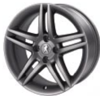
Lita platišča Stromboli Dark 17"