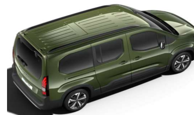
4QM0 - ZELENA KHAKI