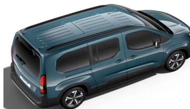
M6M0 - MODRA LIBECCIO