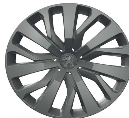
Serijsko na nivoju opreme ALLURE 16" jeklena platišča z okrasnimi pokrovi 'TONGARIRO'