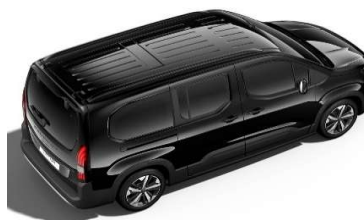
9VM0 - ČRNA PERLA NERA