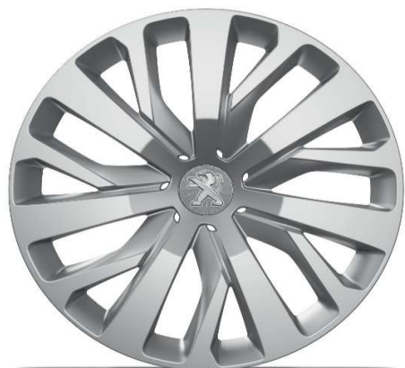
Serijsko na nivoju opreme ACTIVE PACK Jeklena platišča z okrasnimi pokrovi 40,64 cm (16") 'RAKIURA'