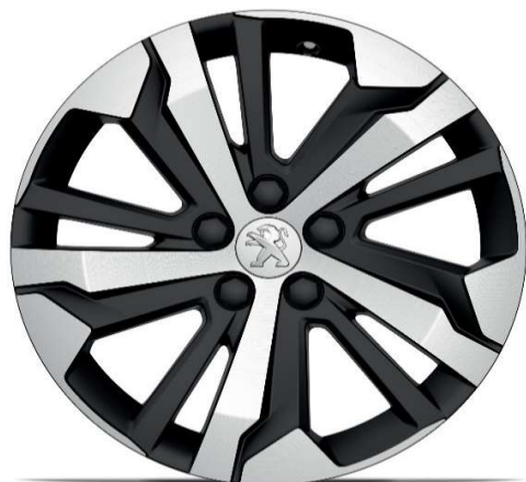
Serijsko na nivoju opreme GT 17" ALU platišča 'AORAKI'