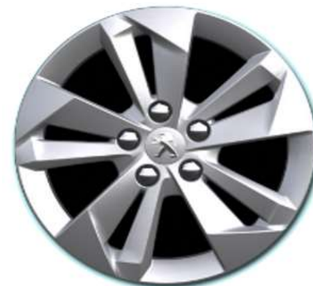
Opcijsko na nivoju opreme ALLURE 16" ALU platišča 'TARANAKI'